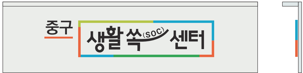
메인간판 예시 A

규격 지정비율 재질 금속, 아크릴 제작 입체문자 & 그래픽 부착, 상단 외부 조명 배치