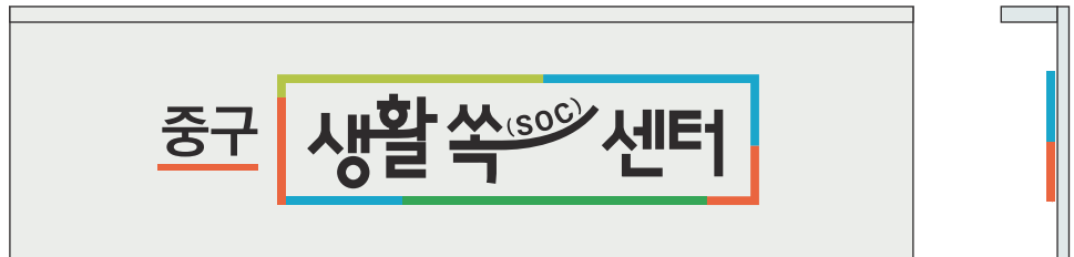
메인간판 예시 B

규격 지정비율 재질 금속, 아크릴 제작 입체문자 & 그래픽 부착, 상단 외부 조명 배치