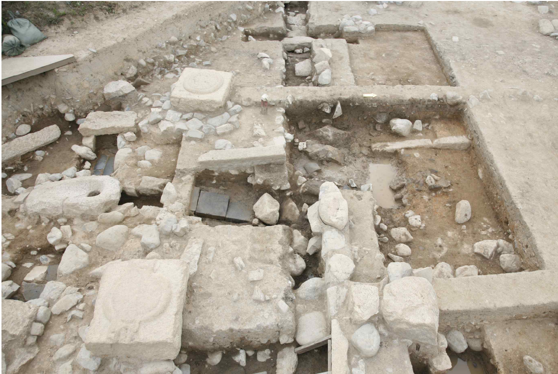
<변기 시설과 배수시설 연결 모습>