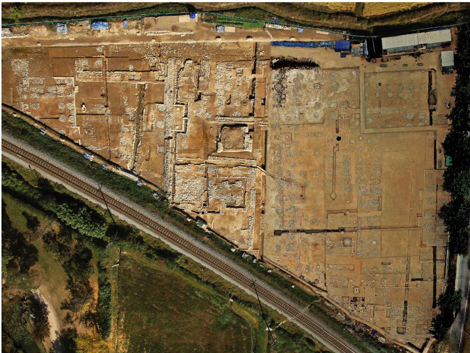
<경주 동궁과 월지 '가'지구 유구현황>