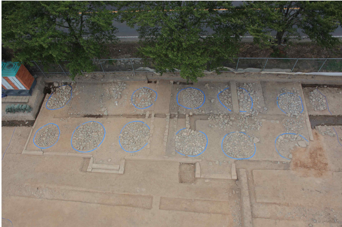
<동문 추정 대형건물지>