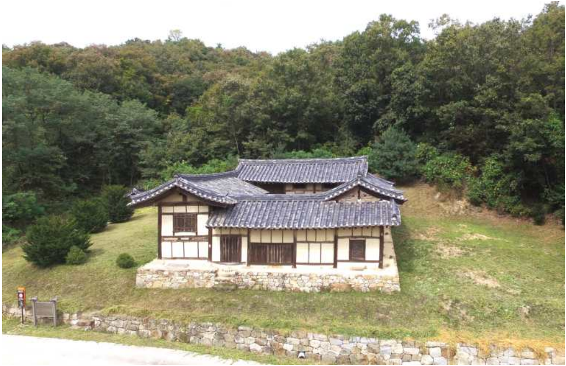
<재사 주변 전경>