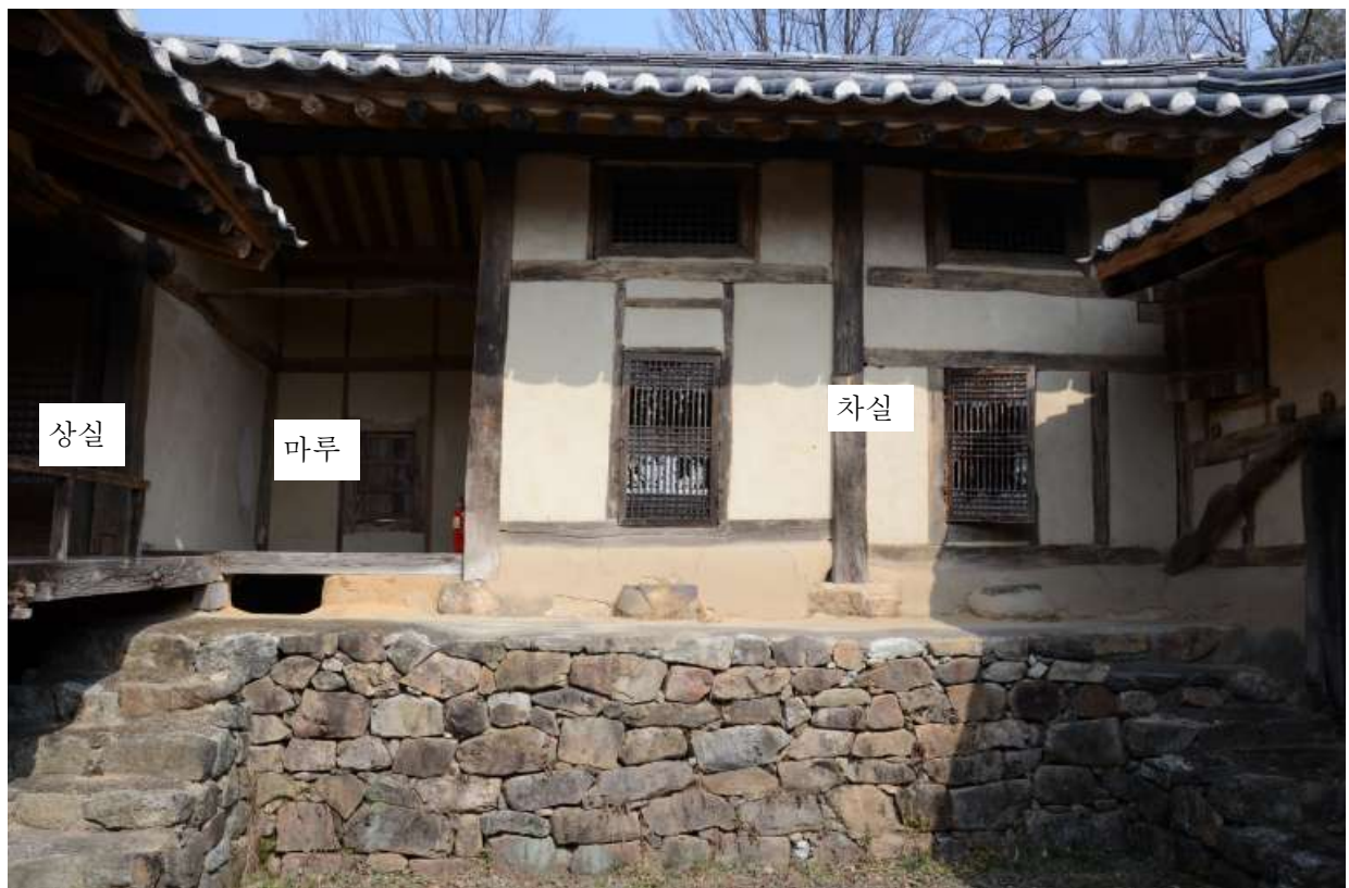
<상실, 마루, 차실>