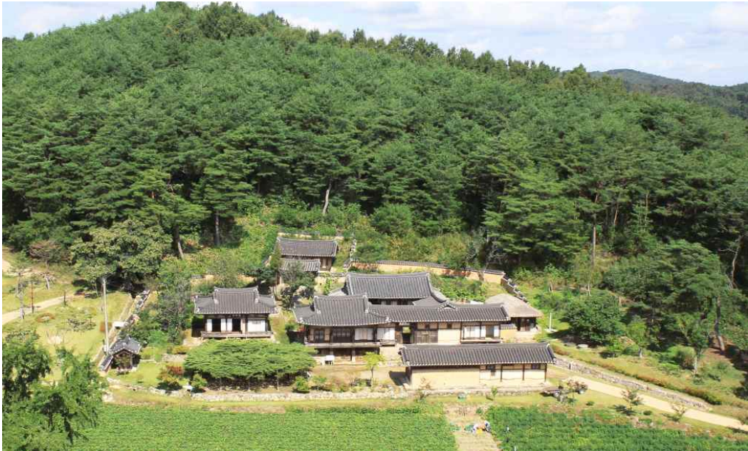
<종택 주변 전경>