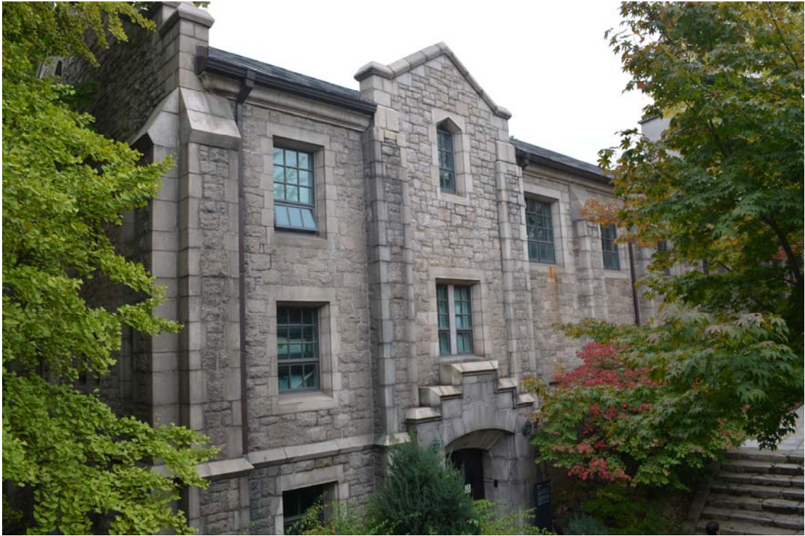
<서울 이화여자대학교 토마스홀 정면>