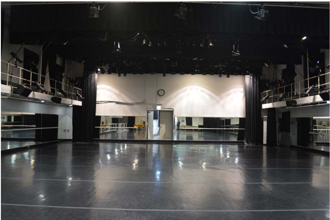
<서울 이화여자대학교 토마스홀 내부>