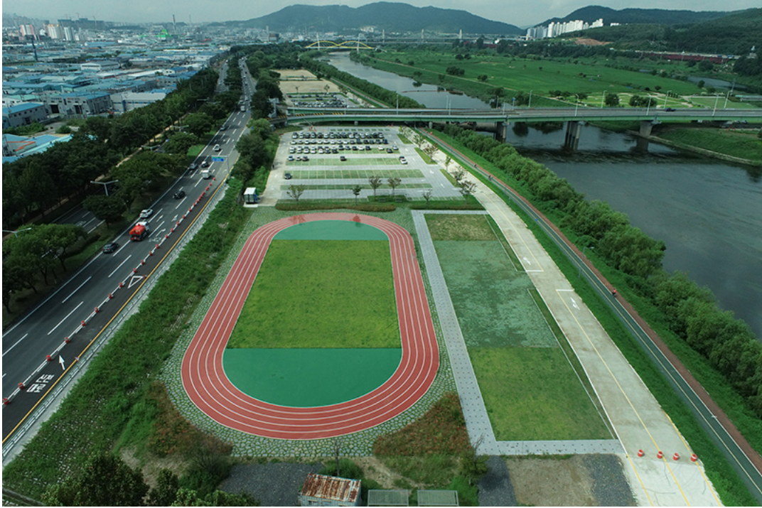
▲ 다목적광장(주차장) 조성

스케이트장 등을 운영하오니 시민들의 많은 이용 바라며, 앞으로 하중도를 국내 최대 4계절 관광명소로 만들어갈 계획”이라고 말했다.