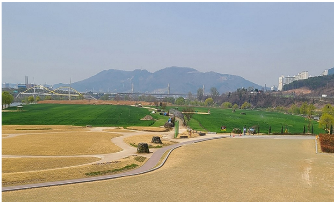
▲ 청보리 단지 조성

올해부터는 하중도 주변 좌안 둔치에 여름철 물놀이장과 겨울철 스케이트장을 운영해 팬데믹 상황에서 오랜 기간 사회적 거리두기로 지친 시민들에게 보다 편리하게 수변공간과 친수문화를 즐길 수 있도록 할 예정이다.