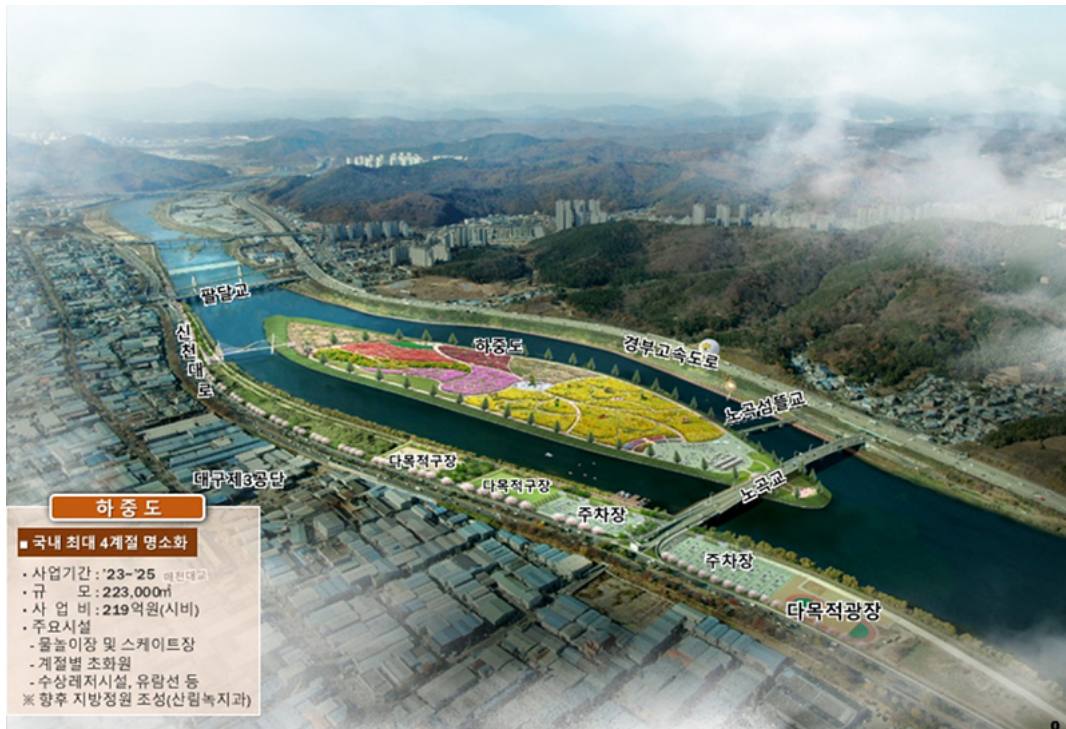
〈4계절 명소화 조감도〉

코로나 이전 연간 30여만 명의 시민들이 즐겨 찾는 금호강 하중도를 전국적 관광명소로 만들고자 2017년부터 총사업비 154억원을 투입해 작년에 주요 기반시설을 완공(주차장, 진·출입도로, 보도교 등)하고, 잔여 사업인 경관개선(교량경관조명, 하중도 내 조명등 설치) 사업을 연말까지 마무리할 예정이다.