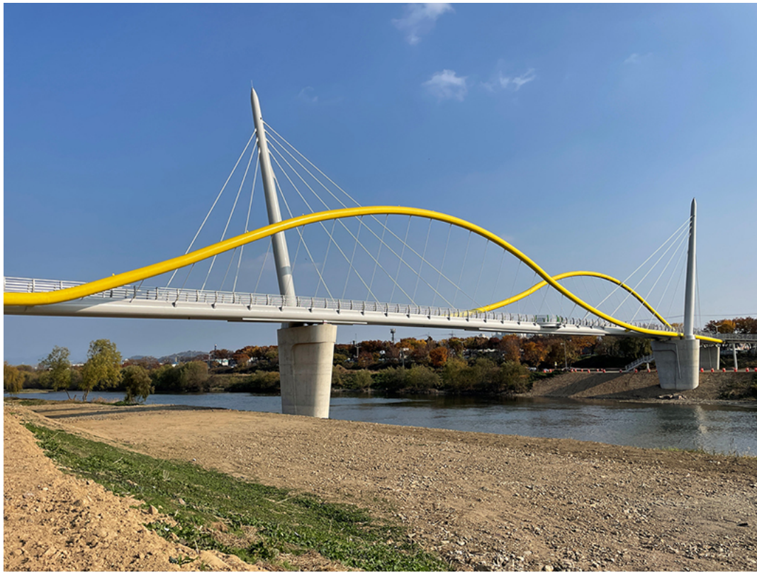
▲ 3호선 연계 보도교 건설

5월 23일(월)부터 27일(금)까지 지역에서 개최(EXCO)되는 세계가스총회(행사참가 90개국, 참가자 12,000명)기간에 맞추어 금호강 하중도에 다양한 초화류와 청보리 단지를 조성해 총회 참가자들에게 다양한 볼거리를 제공토록 할 계획이며,