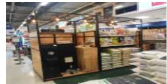
▶ 즉석 도정코너