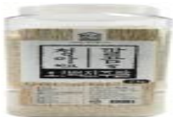
▶ 1차 원물제품(소포장 쌀)