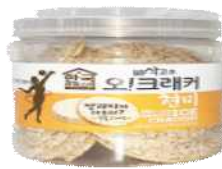
▶ 2차 가공제품(현미크래커)