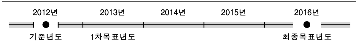
<표1-2> 시간적 범위