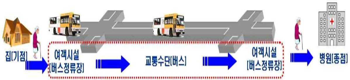
[그림 4-2] 교통약자 이동편의지수 산정 방법